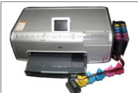
Coloque el CISS en el lado derecho de la impresora.