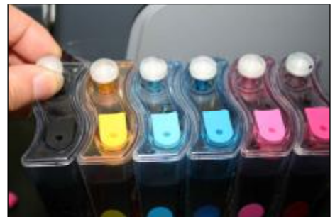
Coloque los filtros en el agujeros de respiración de cada tanque