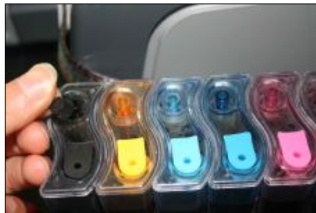
Quitar los taponcitos de los agujeros de respiracion de cada uno de los tanques