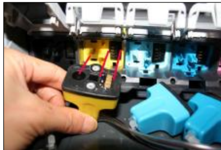
Antes de instalar los cartuchos compruebe que se posicionarán correctamente