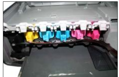
Instale los cartuchos de izquierda a derecha