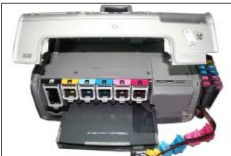
Abra la tapa y retire los cartuchos anteriormente instalados