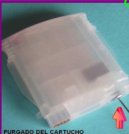
PURGADO DEL CARTUCHO

Los taponcitos de transporte, una vez hayan sido retirados y los cartuchos estén funcionando, guárdelos por si necesitara transportar nuevamente los cartuchos llenos de tinta.